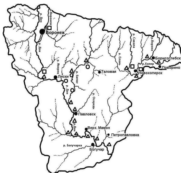
Рис. 2. Приуроченность массового нападения мошек к руслам рек Воронежской области (пункты, где отмечена высокая численность нападающих мошек в 1979 [4], обозначены кружками, в 2005 – квадратами [5], в 2013 - треугольниками)

По данным энтомологических сборов массовое нападение мошек в Воронежской области в 2013 году наблюдалось в период с 8 по 25 мая, что на 10-12 дней раньше среднегодовых показателей [8, 9]. В пойме реки Дон за 5 минут сборов энтомологическим сачком со съёмными мешочками около человека отлавливалось в среднем 180-240 экземпляров мошек (14.05.2013, Лискинский р-н, окр. с. Троицкое), в пойме реки Савала – 80-90 экземпляров (24.05.2013, Новохоперский р-н, окр. с. Листопадовка), в пойме реки Хопер – 100-130 экземпляров (24.05.2013, Новохоперский р-н, окр. г. Борисоглебск). В среднем активность нападения симулиид во вторую декаду мая составила 70-80 экземпляров за 5 минут отлова энтомологическим сачком около человека.